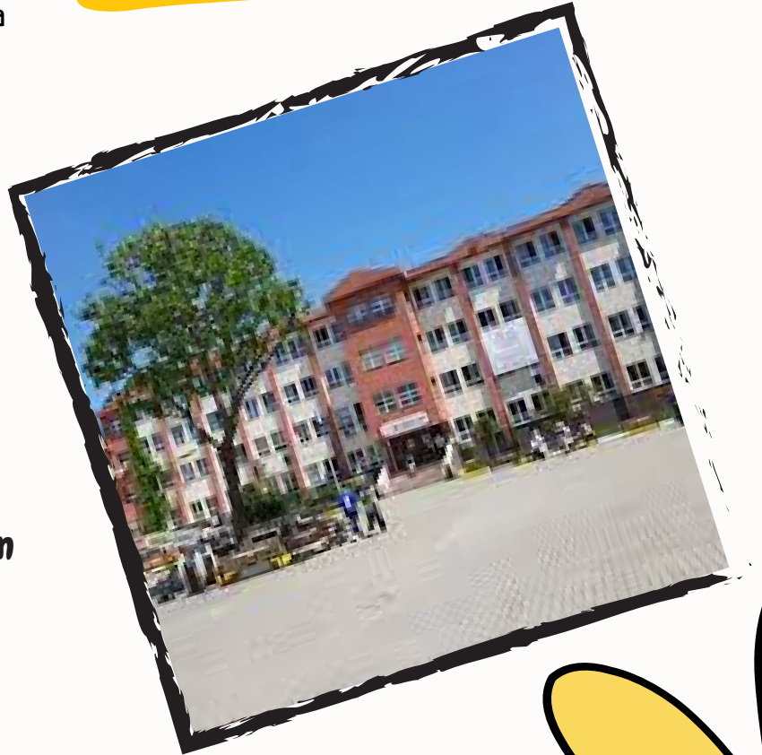
Hazırlayan Derya DEMİR

Sosyal bilimler liselerinden mezun olan öğrencilerin ağırlıklı seçtikleri bölümler; Hukuk, psikoloji, kamu yönetimi, siyaset bilimi, uluslararası ilişkiler, iktisat, ekonomi ve edebiyattır.