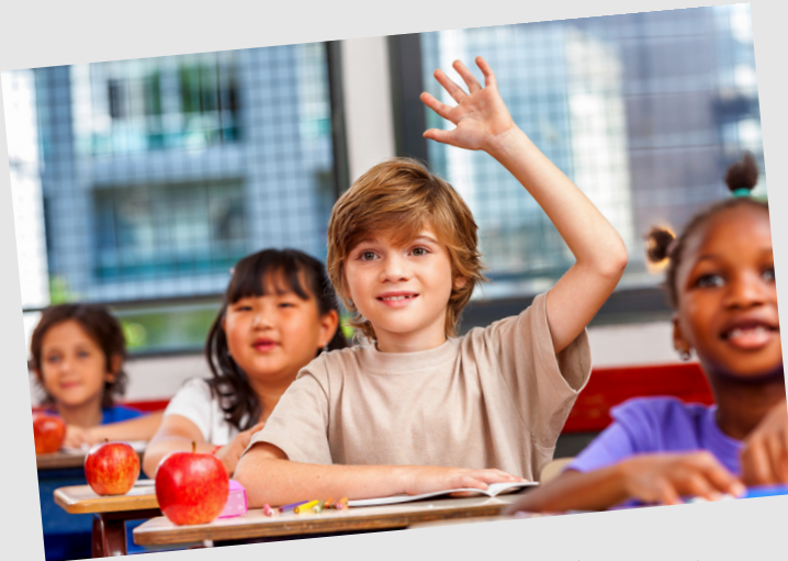
Hazırlayan İnanç MENKİS