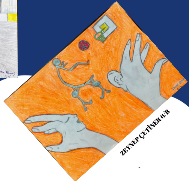
ZEYNEP ÇETİNER 6/B