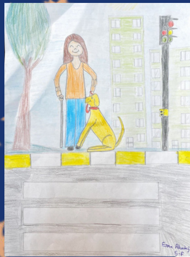
ESMA ALTUNDAĞ 5/F